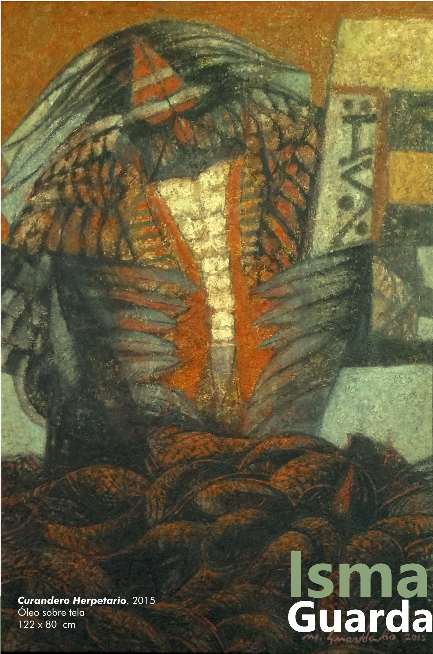
Curandero Herpetario , 2015 Óleo sobre tela 122 x 80 cm