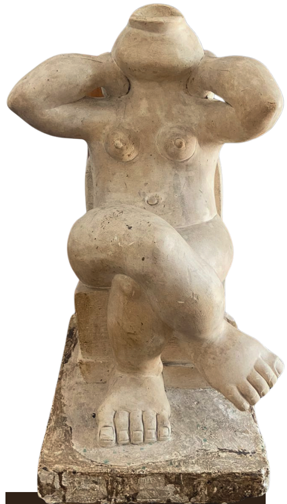
Bebedora de lluvia 1960 - 1972