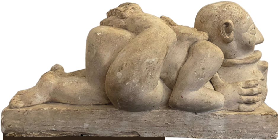
Acoplamiento 1960 - 1972