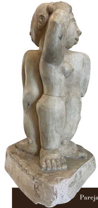
Pareja Entrecruzada Ca. 1960