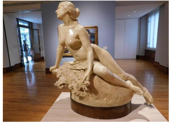
Ariadna Abandonada 1898, Yeso patinado