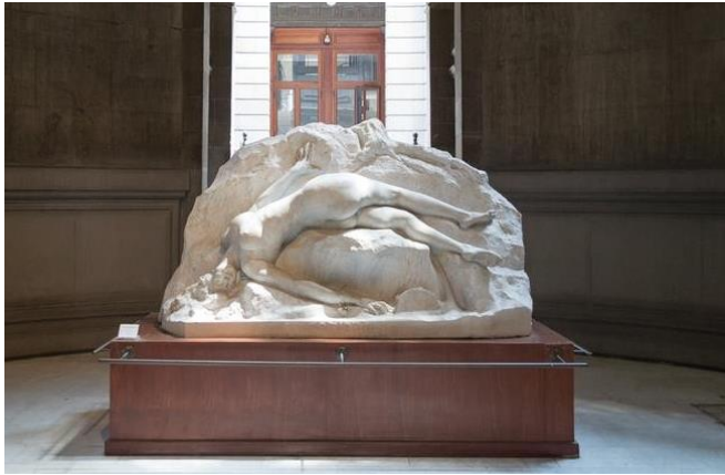
Après l'Orgie (Después de la orgía) 1909, Mármol