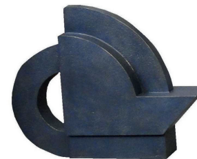
ALFABETO PRIMITIVO 8 104 X 130 X 34 CM BRONCE CERA PERDIDA