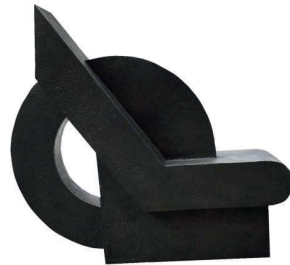
ALFABETO PRIMITIVO 1 117 X 126 X 36 CM BRONCE CERA PERDIDA