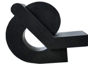
ALFABETO PRIMITIVO 3 102 X 130 X 34 CM BRONCE CERA PERDIDA