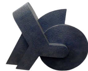
ALFABETO PRIMITIVO 9 135 X 107 X 33 CM BRONCE CERA PERDIDA