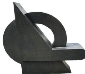
ALFABETO PRIMITIVO 7 116 X 120 X 34 CM BRONCE CERA PERDIDA