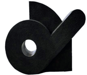
ALFABETO PRIMITIVO 4 96 X 121 X 34 CM BRONCE CERA PERDIDA