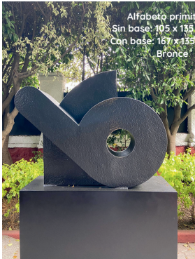
Alfabeto primitivo 2 Sin base: 105 x 135 Con base: 167 x 155 Bronce