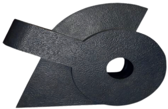
ALFABETO PRIMITIVO 5 100 X 125 X 34 CM BRONCE CERA PERDIDA