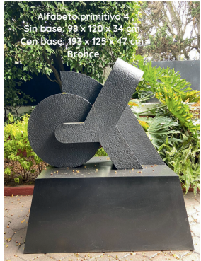
Alfabeto primitivo 1 Sin base: 98 x 120 x 34 cm Con base: 105 x 125 x 47 cm Bronce