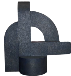
ALFABETO PRIMITIVO 2 106 X 109 X 67 CM BRONCE CERA PERDIDA