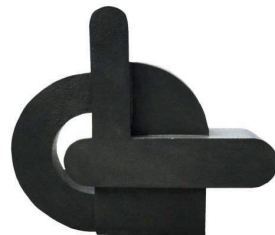
ALFABETO PRIMITIVO 6 118 X 130 X 34 CM BRONCE CERA PERDIDA