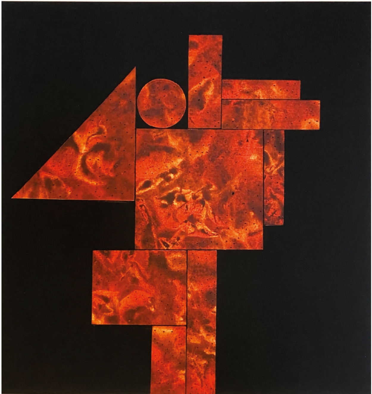
Sin título Obra Matriz Circa 1960 Monotipo 2021 Monotipo 33 x 35 cm Medida del papel: 45 x 46.5 cm