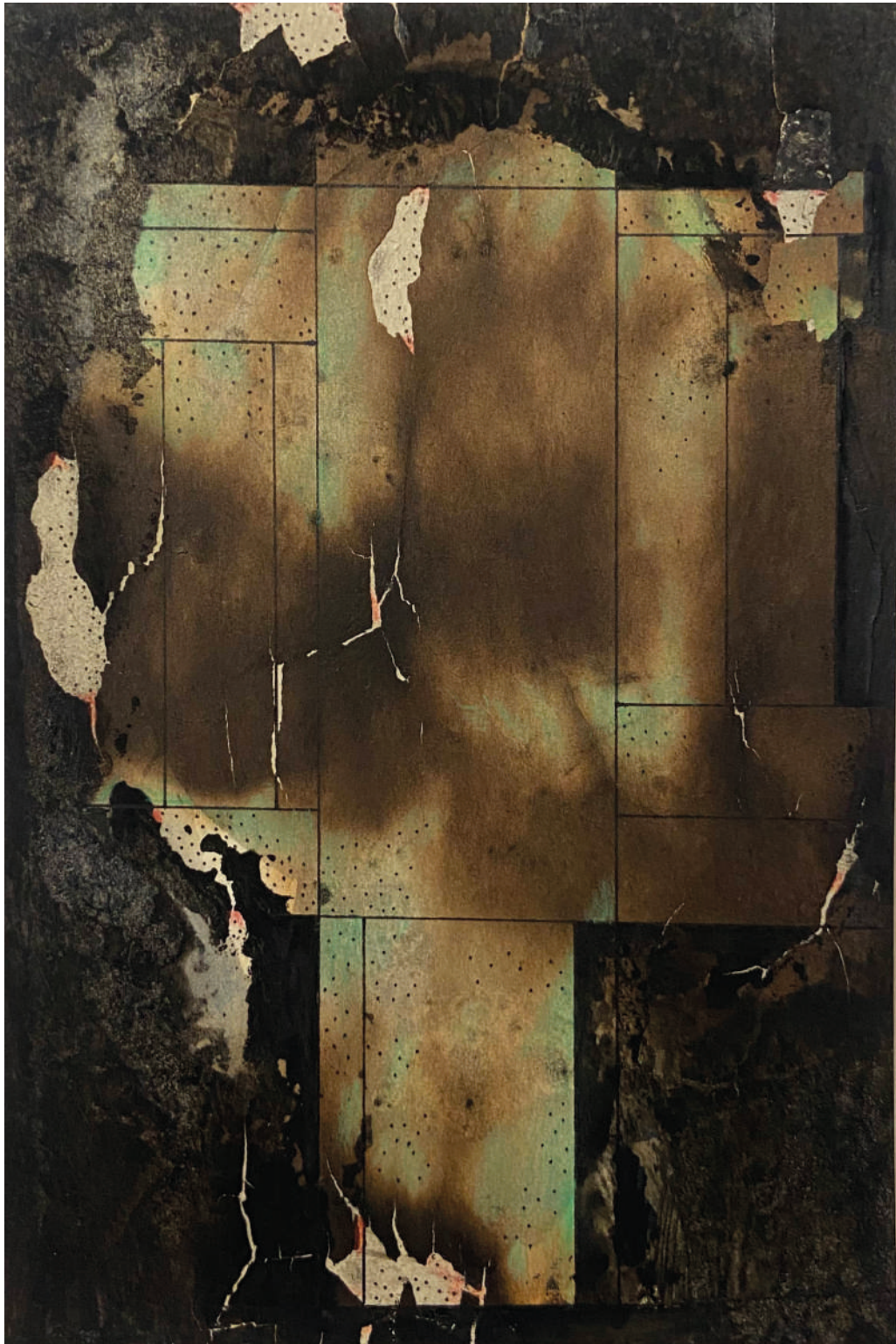
Sin título Circa 1960 Mixta sobre papel y cartón intervenido 11 x 16 cm Medida con marco: 38.3 x 32.5 cm