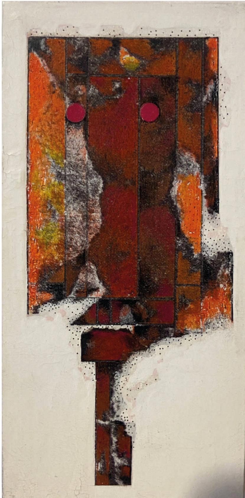
Sin título Circa 1960 Mixta sobre cartón intervenido 9 x 18.5 cm Medida con marco: 40 x 31 cm