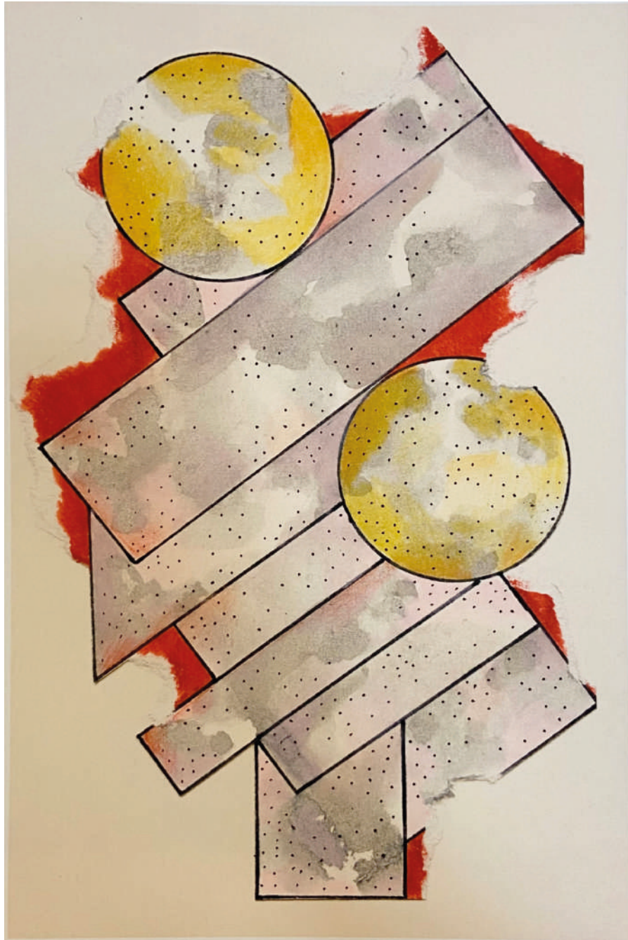
Sin título Obra Matriz Circa 1960 Monotipo 2021 Monotipo 23 x 35 cm Medida del papel: 35 x 47 cm