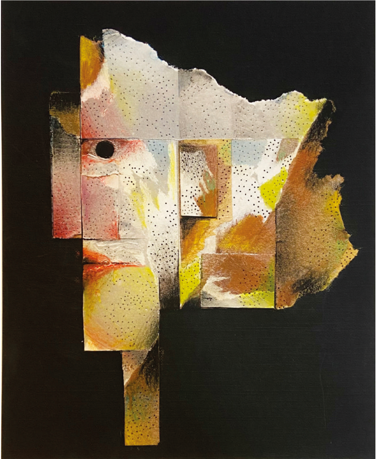
Sin título Obra Matriz Circa 1960 Monotipo 2021 Monotipo 27.5 x 35 cm Medida del papel: 40 x 47.5 cm