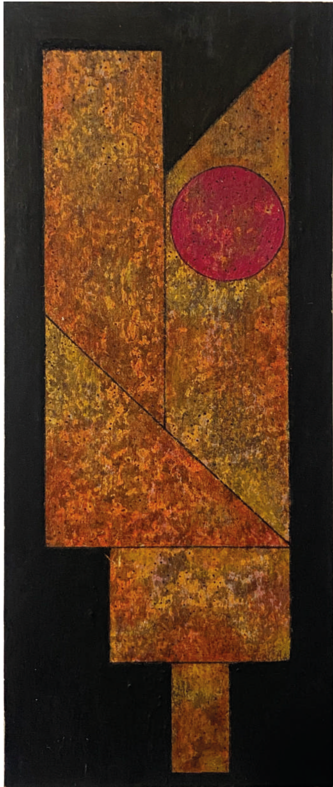
Sin título Circa 1960 Mixta sobre cartón 18 x 7.5 cm Medida con marco: 40 x 29 cm