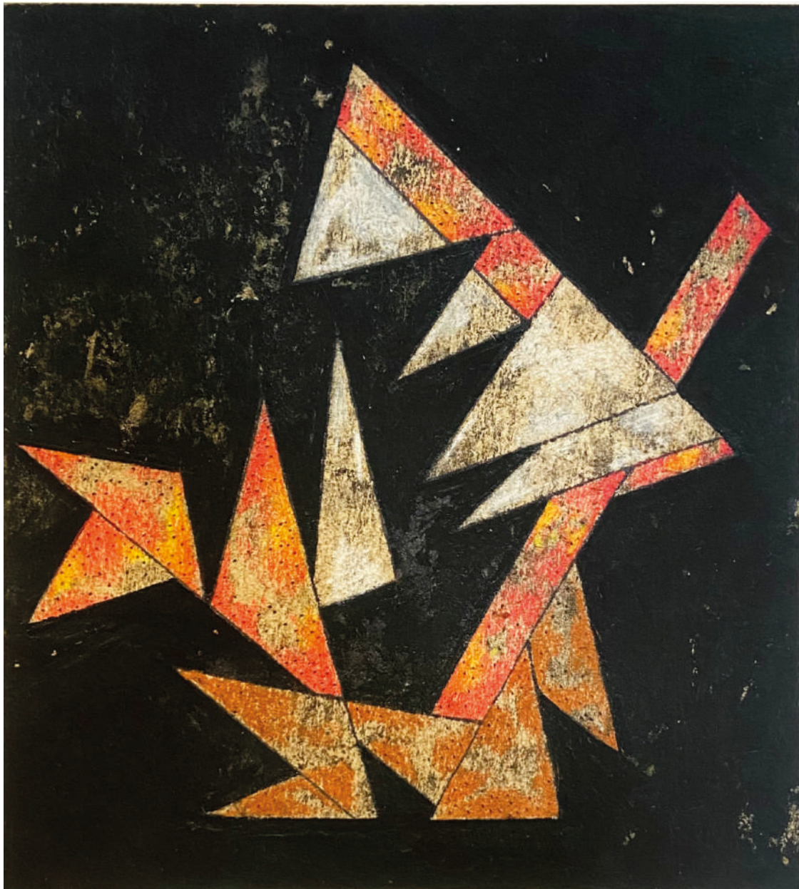
Sin título Obra Matriz Circa 1960 Monotipo 2021 Monotipo 31.5 x 34.5 cm Medida del papel: 43.5 x 47 cm