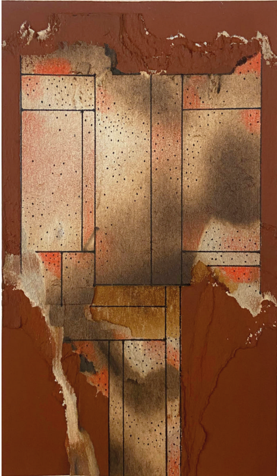
Sin título Circa 1960 Mixta sobre cartón intervenido 15 x 20 cm Medida con marco: 41 x 33 cm