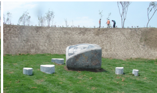
Núcleo , 2012, Parque Ecológico, Angelópolis, Puebla, México.