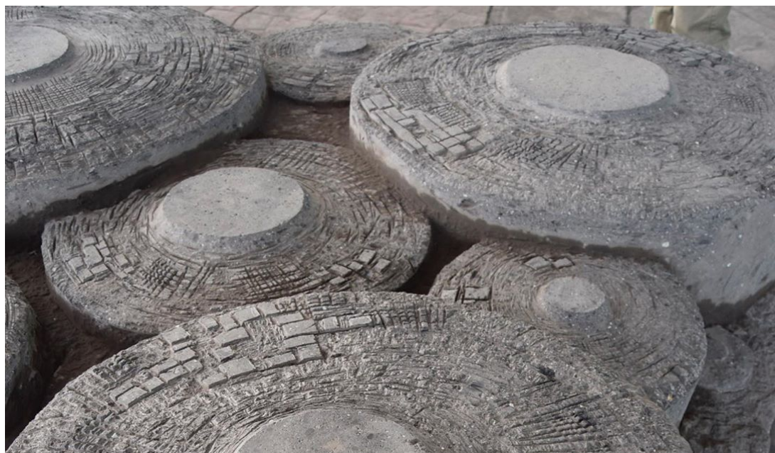
Mézzümü , 2007, Primer Simposio Internacional de Escultura en Piedra Metamorfosis, San Felipe del Progreso, Zona Mazahua, Estado de México.