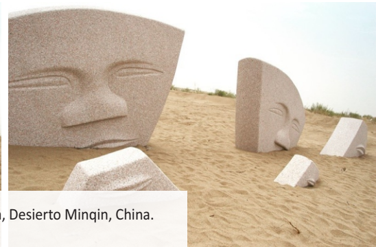
Janos , 2019, Segundo Simposio Internacional de Escultura, Desierto Minqin, China.