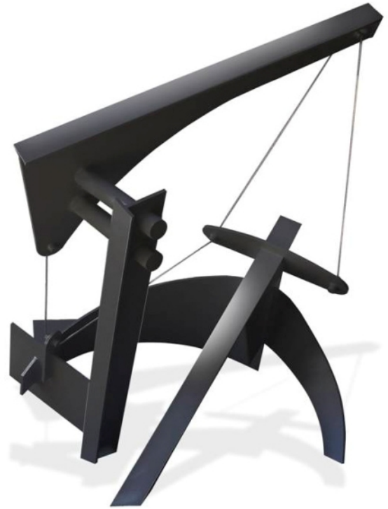
Manuel Felguérez / Geometría suspendida , 2013 Acero pintado / 185 x 190 x 185 cm

La exposición estará abierta al público de lunes a viernes de 10 a 18 horas y los sábados de 11 a 14 horas a partir del 15 de junio del 2013.